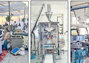
रेवाड़ी। हैफेड मील में हैफेड मील में स्थापित आटा-चक्की युनिट।

आटे की टेस्टिंग के लिए आधुनिक लैब दूसरी मंजिल पर आटा तैयार होने के बाद टेस्टिंग के लिए आधुनिक उपकरणों से लैस लैब भी स्थापित की गई है। इस लैब से लेकर पूरी मिल में सेंसर व अत्याधुनिक उपकरण लगे हुए हैं।