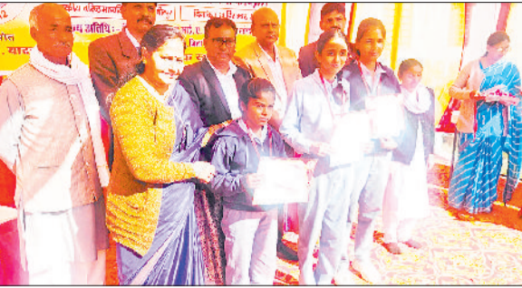
नारनौल। प्रतिभाशाली विद्यार्थियों को सम्मानित करते मुख्यअतिथि व अन्य।