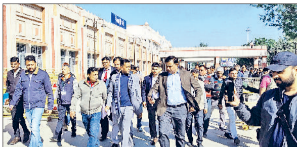
रेवाड़ी। रेलवे जंक्शन पर कार्यों का अवलोकन करते रेलवे अधिकारी तथा वॉटिंग हाल का निरीक्षण करते रेलवे अधिकारी।