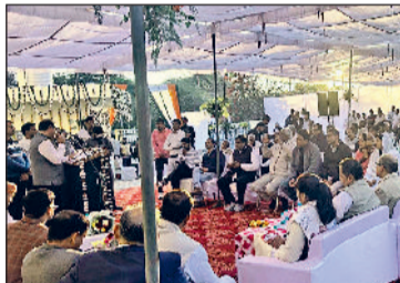
रेवाड़ी। हैफेड मील के उद्घाटन पर लोगों को संबोधित करते विधायक