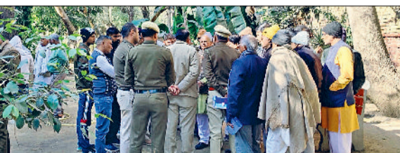
रेवाड़ी। नागरिक अस्पताल में ग्रामीणों को समझाते हुए पुलिस।