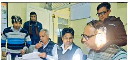
रेवाड़ी। पाह्लावास बिजली सब डिविजन ऑफिस में जांच करती सीएम फ्लाइंग टीम।

सीएम फ्लाइंग ने बुधवार सुबह ऑफिस खुलने के समय से कुछ देर बाद ही पाह्लावास बिजली सब डिविजन ऑफिस में दस्तक दे दी। इससे वहां मौजूद बिजली कर्मियों में हड़कंप मच गया। ऑफिस स्टाफ के 5 कर्मचारी ड्यूटी से नदारद पाए गए। रिकॉर्ड की जांच के दौरान