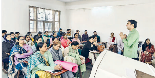
रेवाड़ी। डाइट हुसैनपुर में शिक्षकों को ट्रेनिंग देते प्रशिक्षक।