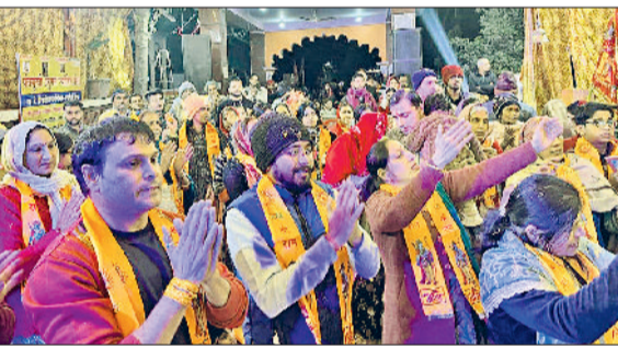
रेवाड़ी। सुंदरकांड में मौजूद श्रद्धालुगण।