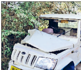
रेवाड़ी। डंपर से टक्कर के बाद क्षतिग्रस्त पिकअप।

डहीना-जाटूसाना रोड पर मंगलवार की रात कहाड़ी गांव के पास एक तेज रफ्तार डंपर ने पिकअप गाड़ी को टक्कर मार दी। हादसा इतना जबरदस्त था कि पिकअप गाड़ी के दो हिस्से हो गए। बाद में डंपर अनियंत्रित होकर एक पेड़ में घुस गया। इस हादसे में दोनों वाहनों के चालक गंभीर रूप से घायल हो गए। उन्हें ट्रॉमा सेंटर में दाखिल कराया गया है। जाटूसाना थाना पुलिस ने डंपर चालक के खिलाफ केस दर्ज कर लिया।